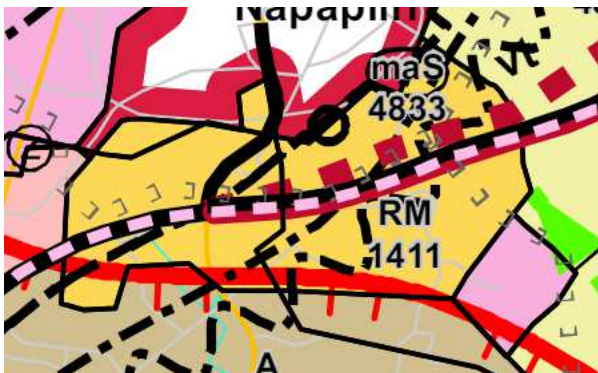
Kuva 5. Ote Rovaniemen ja Itä-Lapin maakuntakaavasta.

Alueella on voimassa 21.9.2022 voimaan tullut Rovaniemen ja Itä-Lapin maakuntakaava, jossa alue on merkitty matkailupalvelujen alueeksi/kohteeksi (RM 1411).