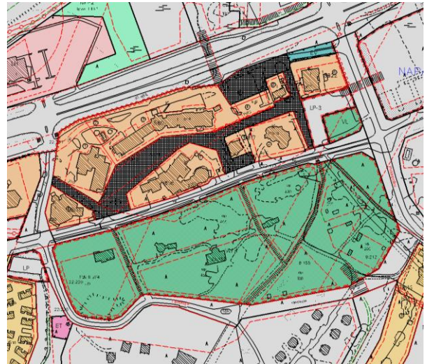
Kuva 4. Voimassa oleva asemakaava.

Alueella on voimassa kaupunginvaltuuston 7.5.2018 §48 hyväksymä asemakaava. Asemakaavassa alueelle on merkitty liike- ja toimistorakennusten kortteli-alueita (K), urheilu- ja virkistyspalvelujen alue (VU-4), katuaukio-/torialue, lähivirkistysalue (VL), autopaikkojen kortteli-alue (LP-3) ja suojaviheralue (EV).