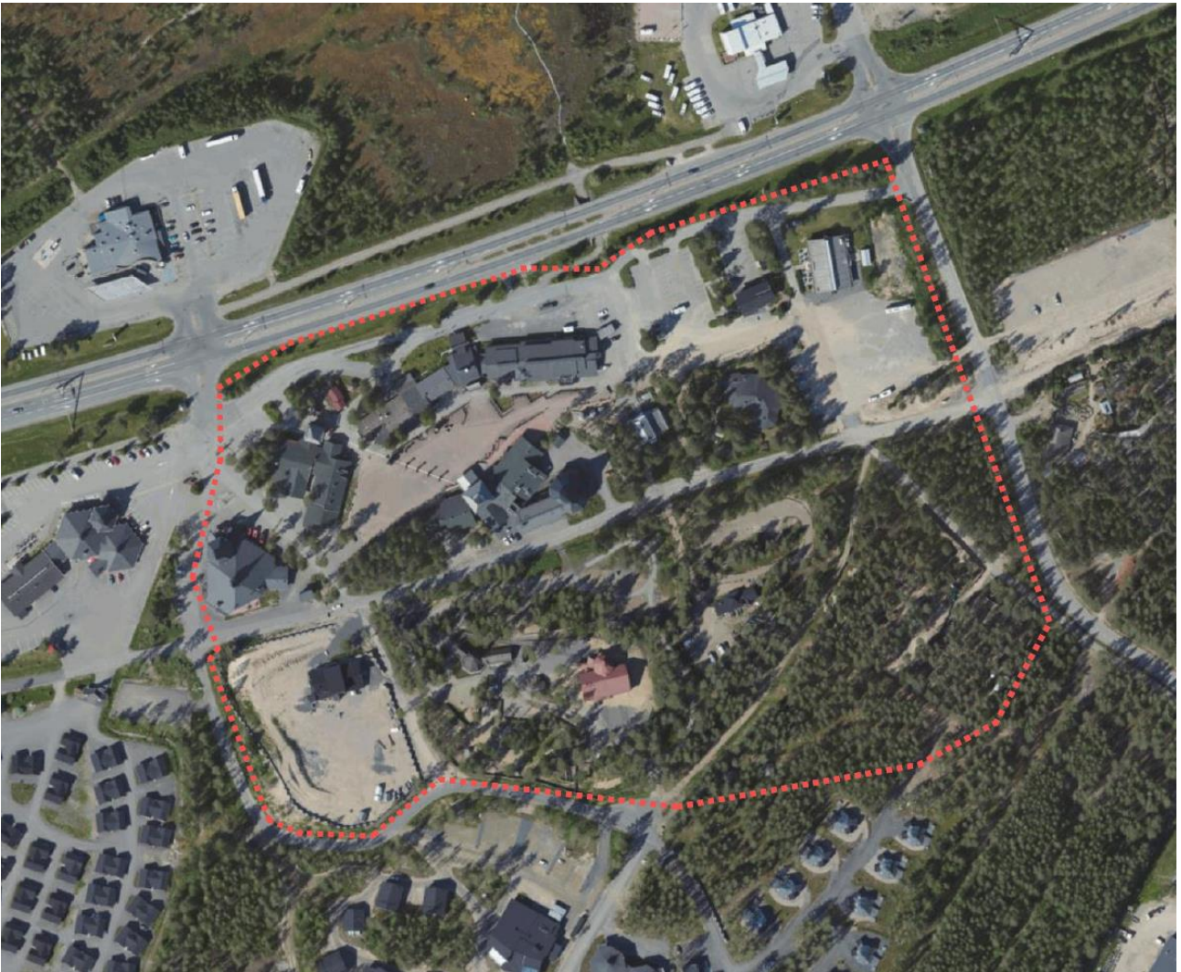
Kuva 1. Ilmakuva suunnittelualueesta, suunnittelualue rajattu punaisella katkoviivalla.

Asemakaavan muutos 18. kaupunginosa korttelit 5803, 5806, 5807, 5817, 5822 sekä katu-, pysäköinti-, erityis-, tori- ja virkistysalue.